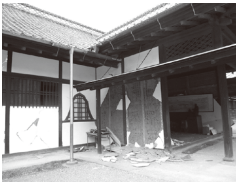
弘道館・正庁玄関の外壁面損傷