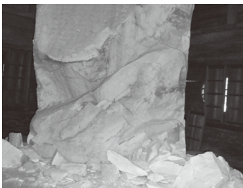
弘道館・弘道館記碑崩落