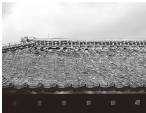
弘道館・至善堂の屋根損傷