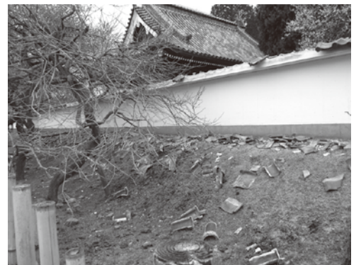
弘道館・孔子廟築地塀の瓦損傷・落下