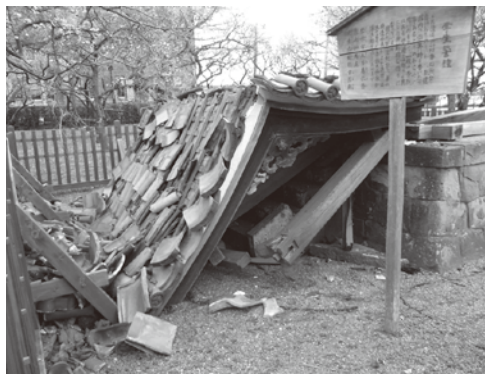
弘道館・学生警鐘(鐘楼)全壊