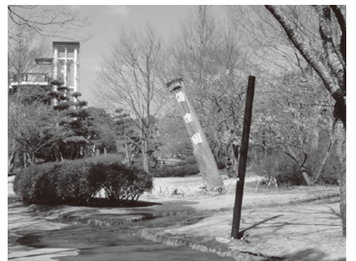
偕楽園・梅桜橋付近地盤沈下による木柱看板の傾き