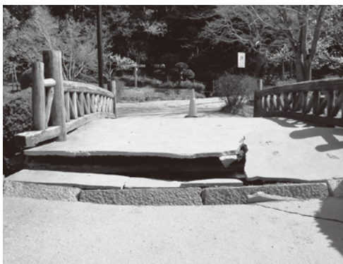
偕楽園・梅桜橋付近の地盤沈下