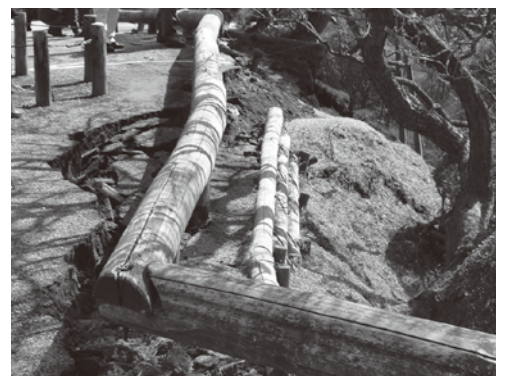
偕楽園・南崖(見晴広場)の法面崩れ